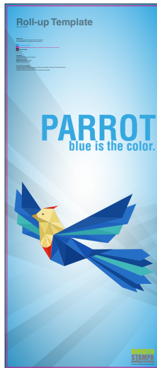
📄 Inserisci la grafica