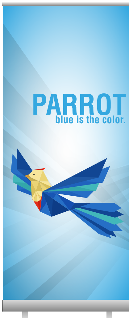
👌 Espositore pronto all'uso